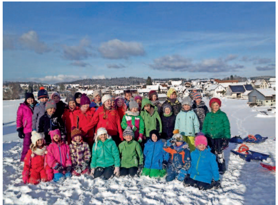
Die Buchheimer Grundschüler grüßen vom Schlittenfahren ...